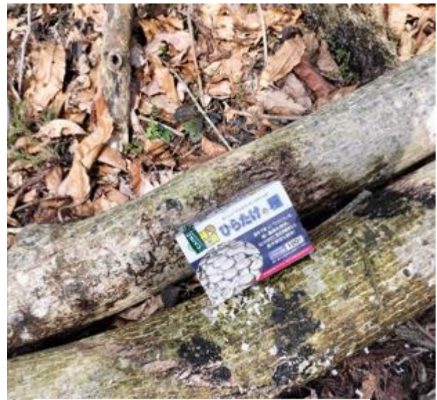
ぜんどこの森でひらたけとなめこを植菌