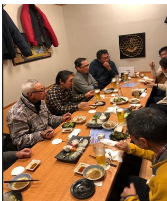
←総会終了後の懇親会

今回の総会では2時間近い時間、組織の在り方や予算の内容について熱心に議論が交わされました。